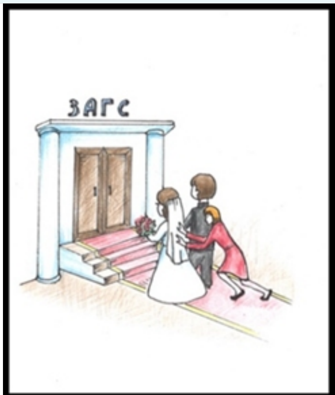
Рис. 3. Что значит не хочу? А ну вперед, а то домой не пуцую!